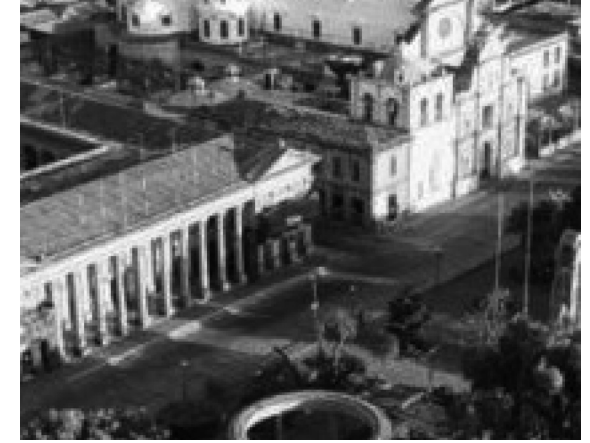
Foto n°1. Centro histórico de la ciudad de Quetzaltenango. Municipalidad, Catedral Altense y Parque a Centroamérica.

1990). Así pues, “el término Centro histórico sobresale hoy entre las expresiones para referirse al urbanismo patrimonial, puede también significar ideas que tienen entre sí diferencias. Si durante el siglo XIX se experimentaron diversas soluciones urbanas que diferenciaron las partes más antiguas de las más modernas de las ciudades, es a lo largo del siglo XX, que el fenómeno del urbanismo histórico es cada vez más reconocido y estudiado, y se intenta precisar la expresión que lo nombra, el concepto y la manera de abordar su protección” (Chateloin, 2008.).