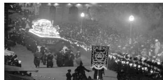
Foto n°3. Procesión de la imagen del Señor Sepultado de la Parroquia de San Nicolás, Quetzaltenango.

Los espacios frente a los Edificios de los Cabildos, hoy Sedes del Gobierno Local, estaban destinados como Plaza de Armas , que tenía proximidad al Templo católico y, a las mansiones aledañas, que eran un símbolo de posición social (Langenberg, 1989). Estas estaban habitadas por criollos que controlaban el comercio mediante la usura a las clases sociales bajas. Se sabe que la casa que hoy alberga la Gobernación Departamental en la ciudad de Quetzaltenango, fue propiedad de una de las familias hegemónicas de aquella época, descendientes de Juan Fermín de Aycinena, proveniente de la Casa de Navarra ; tenía como jardín o patio trasero, parte del denominado, hoy en día, en la actualidad ‘Parque a Centroamérica’.