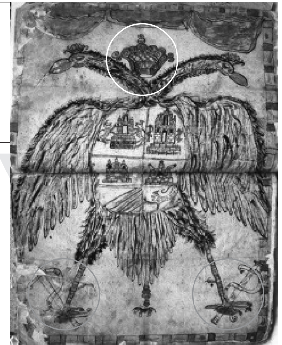
Águila bicéfala de Buenabaj