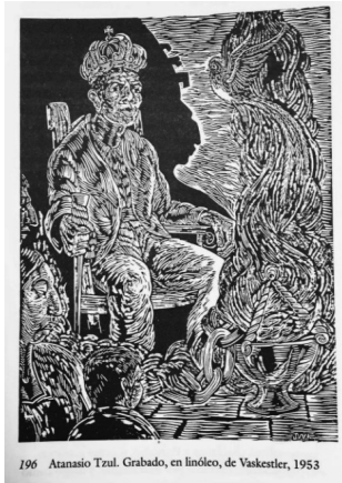
196 Atanasio Tzul. Grabado, en linóleo, de Vaskettler, 1953