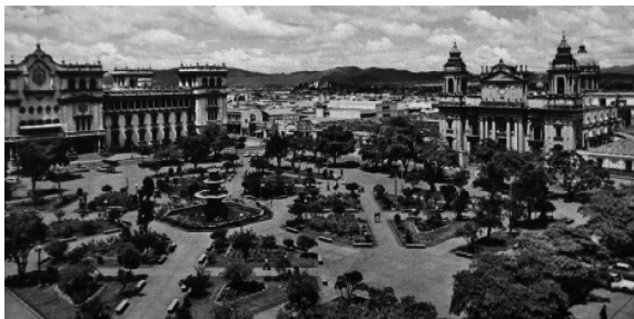
Foto N°2. Centro histórico de la ciudad de Guatemala. Palacio Nacional de la Cultura, Catedral y Plaza Central

Esto, hasta cierto punto, no es cierto porque, en el caso de los denominados pueblos de indios, estos desconocían las Instituciones de procedencia europeas y, menos las legislaciones videntes. Es por ello que los criollos se dieron a la tarea de anular al “otro”, a ese a quien había que ‘civilizar, “porque los indios,