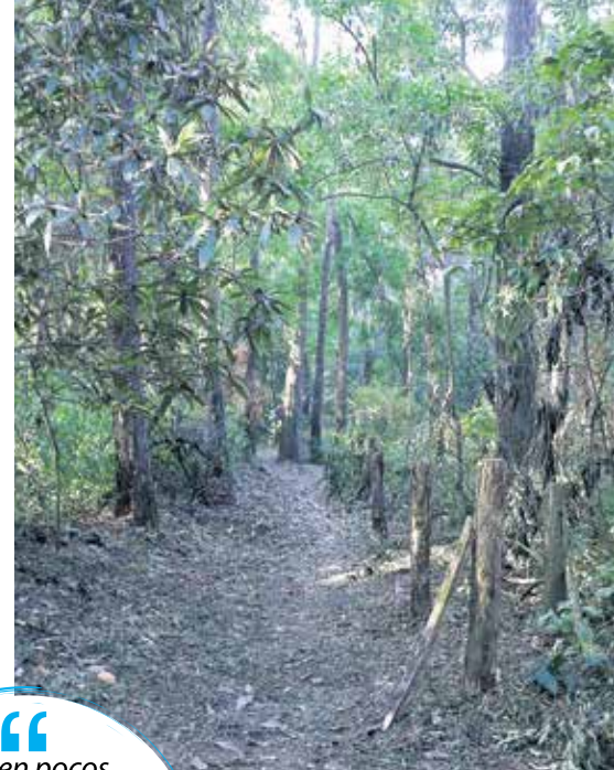
El Parque de las Ardillas es considerado un pulmón de la ciudad.

Hace cinco años, algunos edificios aledaños al Bosque de las Ardillas fueron desalojados; entre ellos, el de la Editorial Universitaria,