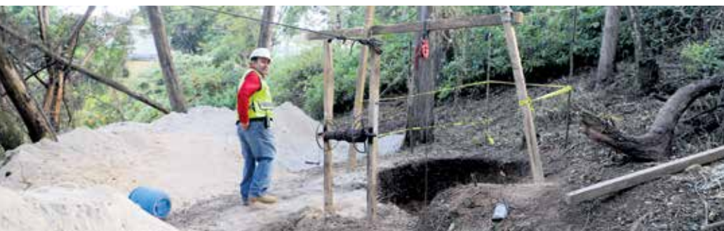
En total se realizaron 5 pozos de visita, por donde pasará el colector.