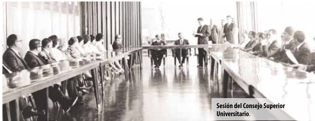
Sesión del Consejo Superior Universitario.

También fue determinante el informe que el obispo Payo Enríquez envió al rey Carlos II en 1659, donde dio a conocer la necesidad de fundar un establecimiento de educación superior; por primera vez se obtuvo una res-