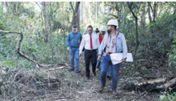
Se estima que durante septiembre finalice la ejecución de la obra.

yecto evitará que el sitio continúe erosionándose y permitirá la recuperación del espacio, para beneficiar a la comunidad universitaria y a los vecinos de la zona 12 capitalina.