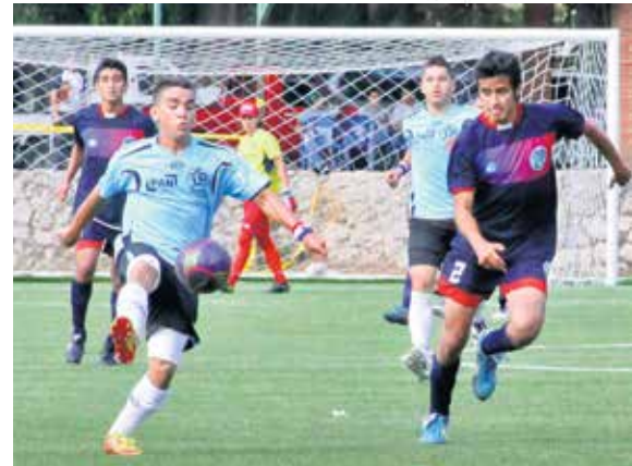
Más de 3 mil deportistas de universidades centroamericanas participarán en las justas deportivas.