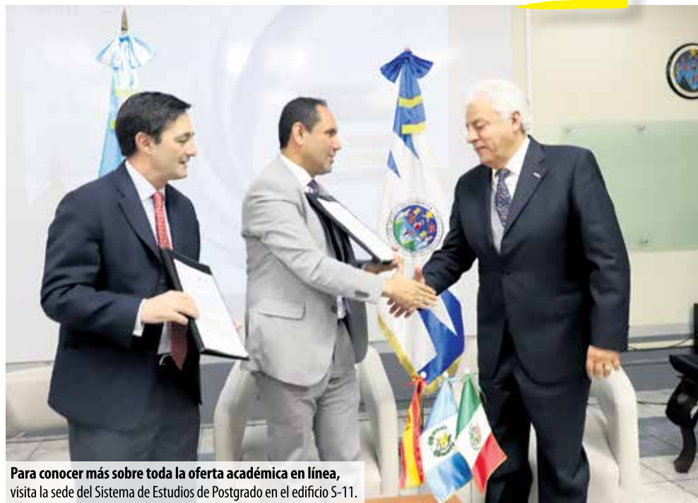
Para conocer más sobre toda la oferta académica en línea, visita la sede del Sistema de Estudios de Postgrado en el edificio S-11.

Los docentes serán totalmente becados. El Rector de la USAC dio la opción de que participe un delegado de cada unidad académica, con el