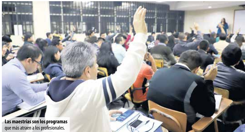
Las maestrías son los programas que más atraen a los profesionales.

En la Tricentenario se pueden estudiar maestrías como Economía Ambiental y de Recursos Naturales; Gestión para la Reducción del Riesgo; Desarrollo Rural; Gestión de la Diversidad Biológica; Derecho Ban-