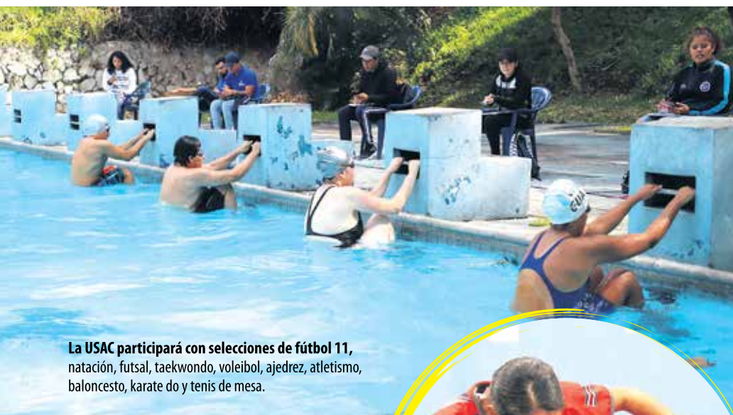
La USAC participará con selecciones de fútbol 11, natación, futsal, taekwondo, voleibol, ajedrez, atletismo, baloncesto, karate do y tenis de mesa.

“Este programa es una referencia para desarrollar la logística y organizar la atención que las catorce comisiones conformadas brindarán a las delegaciones participantes”, explicó el director.