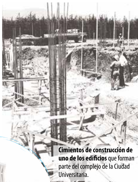
Cimientos de construcción de uno de los edificios que forman parte del complejo de la Ciudad Universitaria.