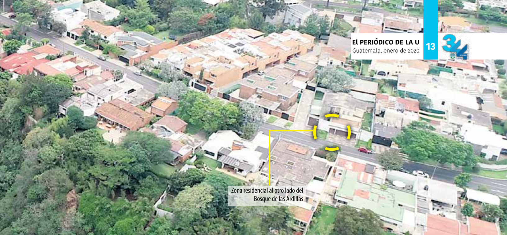
Zona residencial al otro lado del Bosque de las Ardillas