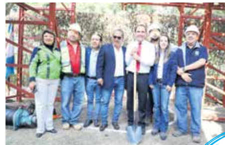
En la fotografía, personal de la Municipalidad de Guatemala y USAC, antes de iniciar el desarrollo de la obra.

Cuando finalice la instalación del colector de aguas, se contempla rellenar parcialmente la cuenca, con el fin de evitar desmoronamientos por lluvia; además, se pretende crear un parque ecológico en toda la cuenca. Es posible que más adelante la universidad y la Municipalidad de Guatemala trabajen en