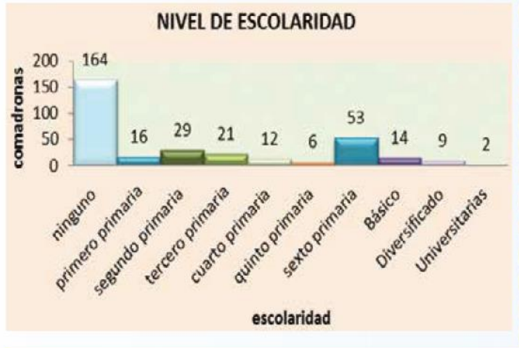
Figura 2. Nivel de Escolaridad.

Finalmente, para comprender la relación de los objetivos y logros hacia los que apunta la Política Nacional que fue analizada, hay que tomar en cuenta los datos, en términos de inversión pública, que son destinados a las acciones que abarcan el elemento étnico-cultural en todo el proceso de la Política Pública, por lo que es pertinente señalar los hallazgos que realizó el Instituto Centroamericano de Estudios Fiscales –ICEFI- que demuestra la desigualdad persistente en la inversión pública, más que como un discurso como una práctica política, jurídica, social y financiera.